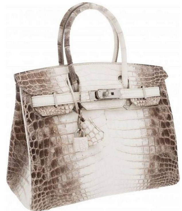
Matte Crocodile Biking