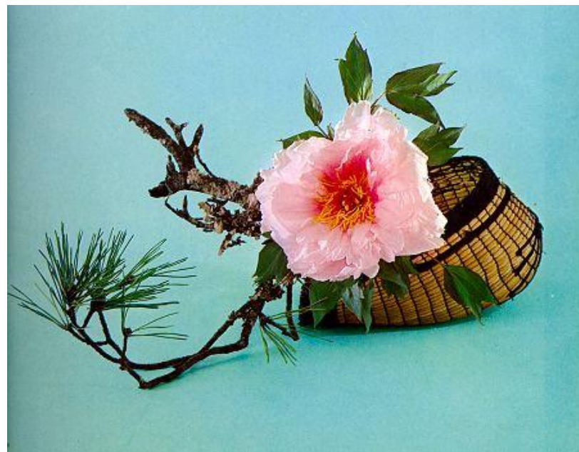
Moribana การจัดในภาชนะทรงเตี้ย