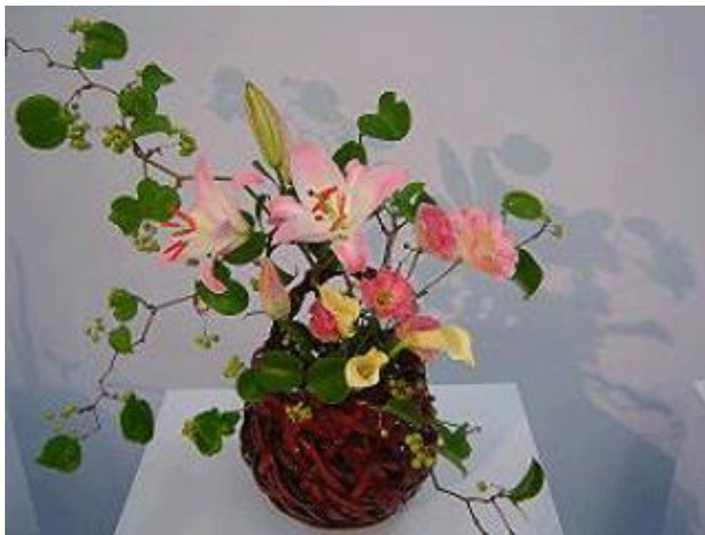
นาเงอิระ (Nageire): แบบธรรมชาติ