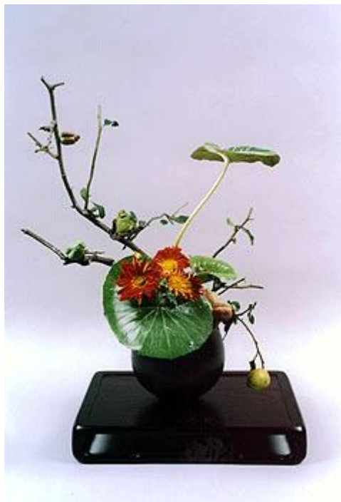
Heika การจัดในแจกันทรงสูง