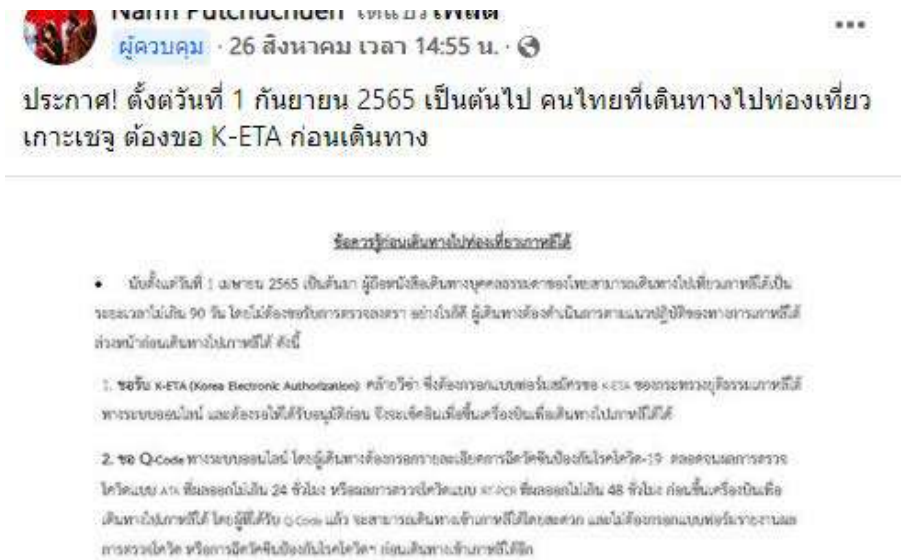
ภาพที่ 4. 1 การแชร์ข้อมูลของแอดมินเพจ

ข้อมูลเกี่ยวกับการจะเข้าไปประเทศเกาหลี ทั้งเรื่องการทำวีซ่า พาสปอร์ต การเตรียมเอกสารขั้นตอนเข้าประเทศ การใช้ชีวิต การขึ้นรถ การหาบ้าน ซึ่งการแบ่งปันข้อมูลต่างๆ บนเพจนี้ต่างมีประโยชน์กับผู้ที่มีความต้องการอยากย้ายไปประเทศเกาหลี นอกจากเพจทั้ง 2 จะเป็นพื้นที่สื่อออนไลน์เพื่อให้สมาชิกเพจเข้ามาสอบถาม แชรร์และแลกเปลี่ยนประสบการณ์หรือข้อมูลในการจะย้ายไปประเทศเกาหลีแล้ว อีกส่วนหนึ่งที่เป็นตัวกระตุ้นให้สมาชิกเพจหรือผู้ที่อยากย้ายไปประเทศเกาหลี ยังมีผู้ที่อยู่เบื้องหลังนั่นก็คือแอดมินเพจหรือผู้ที่สร้างเพจขึ้นมา เพื่อตอบสนองความต้องการของกลุ่มคนที่อยากย้ายประเทศ