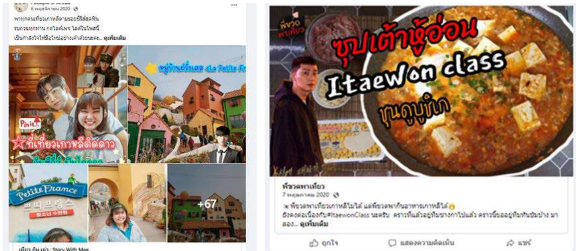
ภาพที่ 1.1 และ ภาพที่ 1.2 โพสต์เกี่ยวกับอิทธิพลซีรีส์เกาหลี ที่มา: เพลง “ขายไตไปเกาหลี”

ปรากฏการณ์ของคนไทยจำนวนหนึ่ง โดยเฉพาะในกลุ่มวัยหนุ่มสาวแสดงออกถึงความต้องการอพยพย้ายถิ่นหรือย้ายประเทศไปยังเกาหลีเป็นจุดเริ่มต้นของงานวิจัยชิ้นนี้ โดยพยายามจะชี้ให้เห็นว่าวัฒนธรรมเกาหลีโดยเฉพาะด้านสื่อมวลชนนั้นส่งผลต่อการตัดสินใจเลือกที่จะย้ายถิ่นไปทำงาน ศึกษาต่อ หรือวัตถุประสงค์อื่นหรือไม่อย่างไร ผู้วิจัยสังเกตจากปรากฏการณ์ในการสื่อสารบนโลกดิจิทัลพบว่าอิทธิพลของวัฒนธรรมเกาหลี เช่น ซีรีส์เกาหลี ถือได้ว่าเป็น พลังแห่งอำนาจละมุน (Soft power) 1 ที่สามารถมีอิทธิพลกับความคิดแบบไม่รู้ตัว (Washingtonpost Newsweek Interactive, LLC, 1990) 2 เราจะพบว่าซีรีส์ในแต่ละเรื่องนั้น มักจะนำเสนอเรื่องราวของอาชีพต่าง ๆ ผ่านตัวละครอย่างหลากหลาย ไม่ว่าจะเป็น อาจารย์ นักข่าว หมอ และยังสอดแทรก เรื่องวัฒนธรรมด้านต่าง ๆ ทั้งทางด้านอาหาร ด้านการดำรงชีวิต ด้านการแต่งกาย รวมถึง